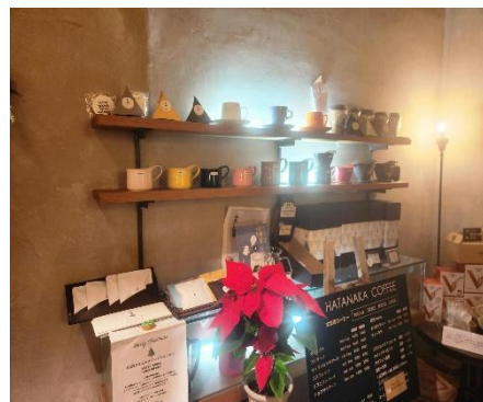
<カップやお菓子も並ぶ>

より多くの人々の生活に取り入れていただくための新たなサービスを始めました。 専用マシンや器具は不要です。詳細は別紙をご参照ください。