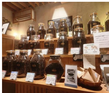
<コーヒー豆の種類も豊富>