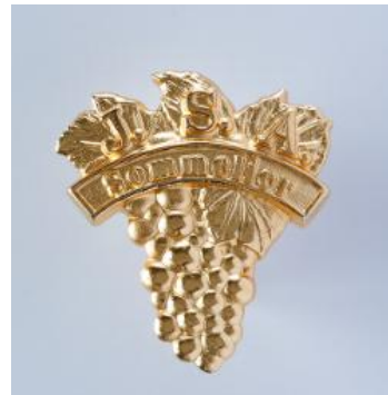
↑ワインソムリエだけが保有するバッジ

→焼酎の原料・製法・熟成による味わいの違いを見極め、料理との相性や飲み方まで幅広く提案し、焼酎の魅力を最大限に引き出す “焼酎のプロフェッショナル” です。